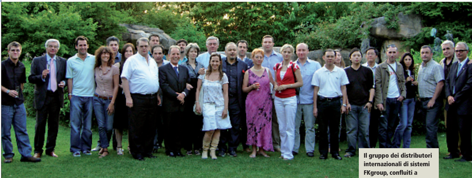
Il gruppo dei distributori internazionali di sistemi FKgroup, confluiti a Dalmine (BG) lo scorso luglio per un open house di quattro giorni a loro dedicato